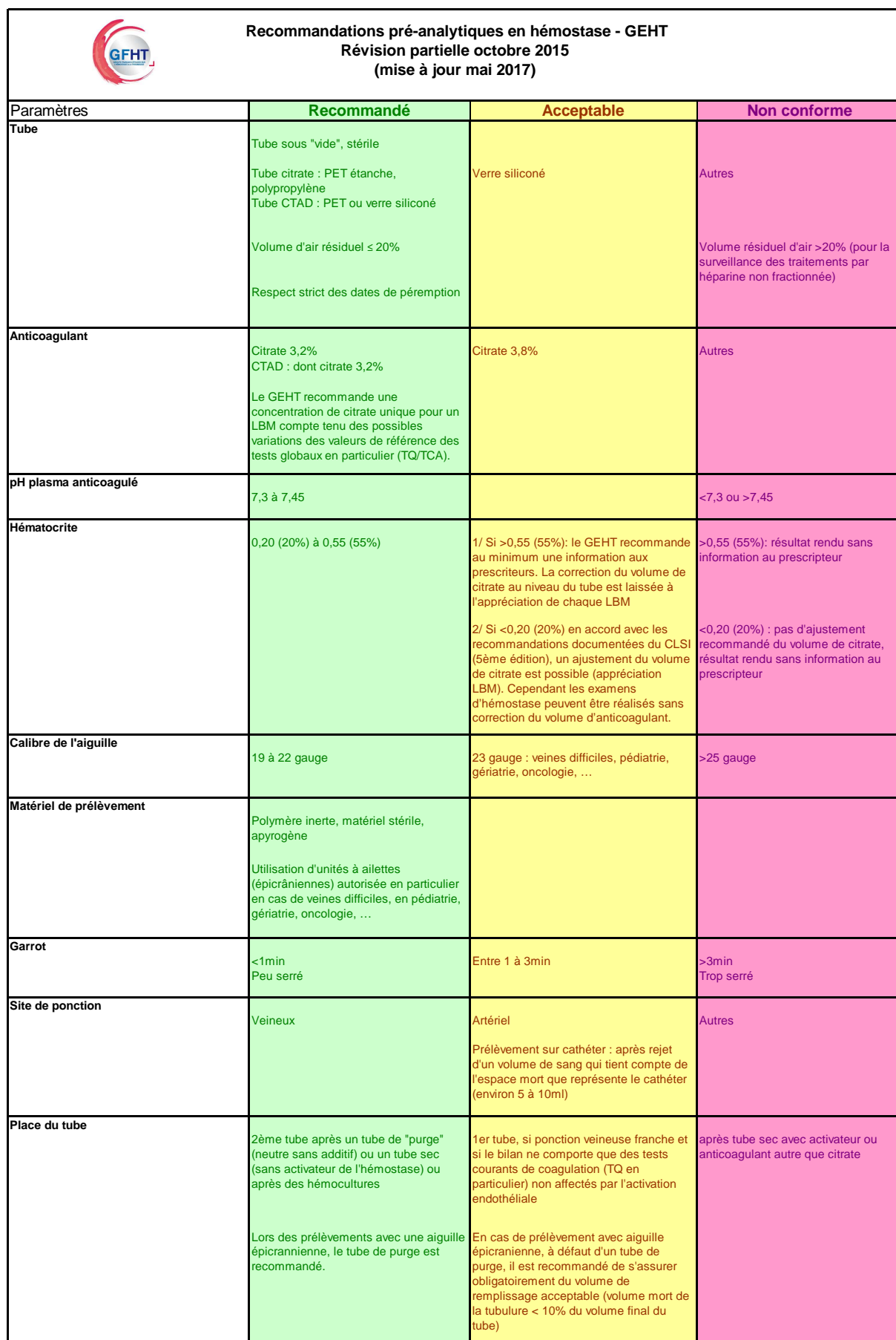
Tableau de synthèse des recommandations préanalytiques